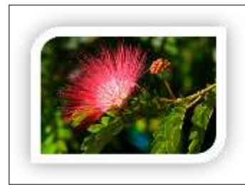
ชื่อพันธุ์ไม้ จามจุรี