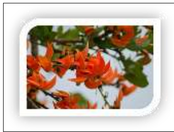
ชื่อดอกไม้ ดอกทองกวาว