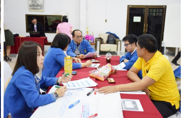
๒.๑๐ กิจกรรมปลูกจิตสำนึกการรับทรัพย์สินหรือประโยชน์อื่นใดของเจ้าหน้าที่ของรัฐตามนโยบาย No Gift policy