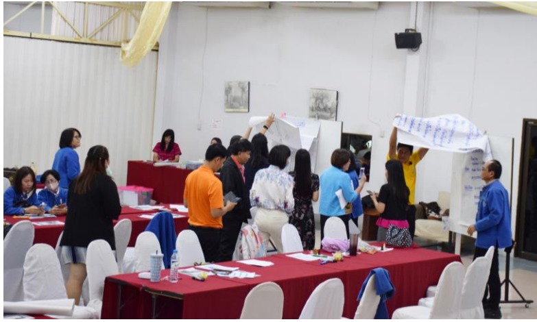
๒.๑๑ กิจกรรม นำเสนอการดำเนินการเพื่อส่งเสริมคุณธรรม จริยธรรม และความโปร่งใสภายในหน่วยงาน ( Best Practice ของแต่ละกลุ่มงาน)