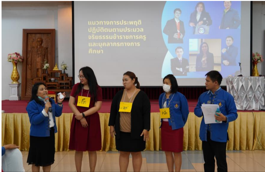
๒.๕ กิจกรรม คัดเลือกบุคลากร สพม.ลพพ เพื่อยกย่องเชิดชูเกียรติด้านจริยธรรม โดยใช้กระบวนการประเมินพฤติกรรมตามประมวลจริยธรรม