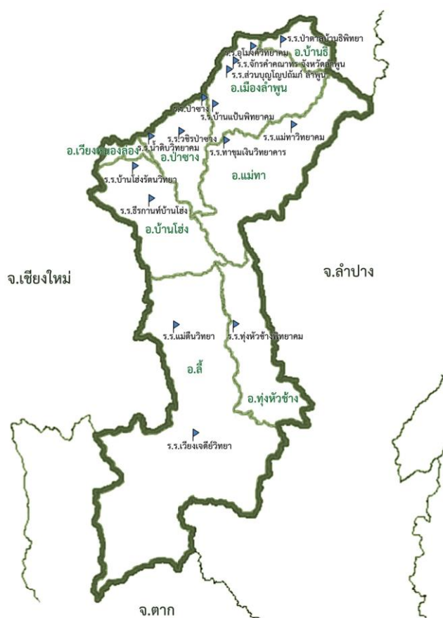
ภาพที่ ๒ ที่ตั้งของโรงเรียนในจังหวัดลำพูน